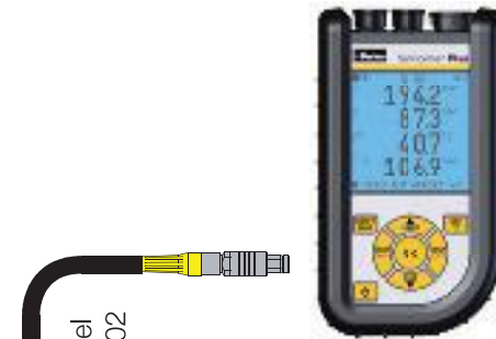
Parker Serviceman Plus SCM-155-0-02