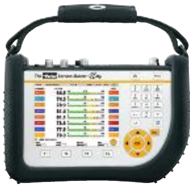
The Parker Service Master Plus SCM-500-01-xx oder The Parker Service Master Easy SCM-330/340