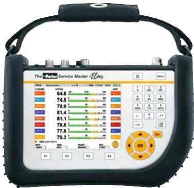
The Parker Service Master Plus SCM-500-xx-xx