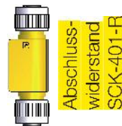
Abschluss- widerstand SCK-401-R