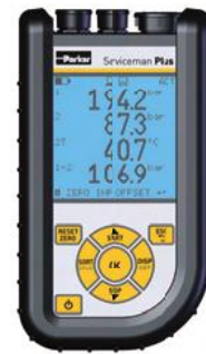
Parker Serviceman Plus SCM-155-2-05