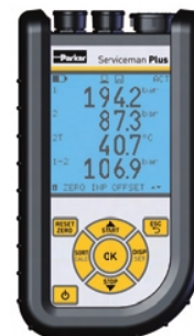
Parker Serviceman Plus SCM-155-2-05