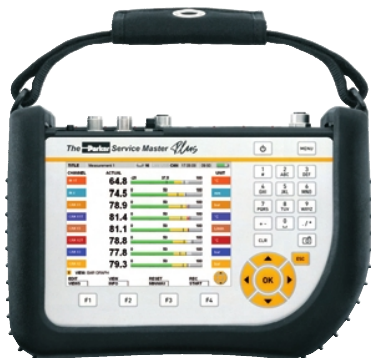
The Parker Service Master Plus SCM-500-xx-xx