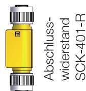
Abschluss- widerstand SCK-401-R